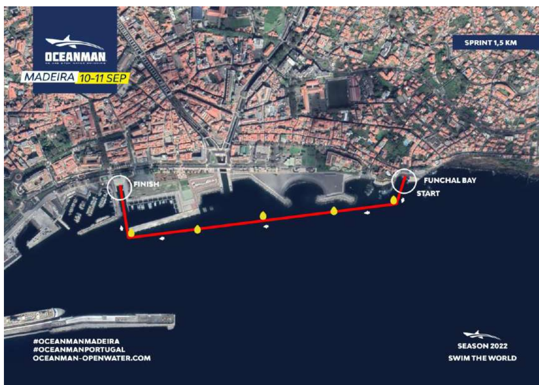
Imagem 5. Croqui – 1,5K SPRINT

Associação de Natação da Madeira Instituição de Utilidade Pública – Resolução n.º 424/2012, de 12 de Junho de 2012