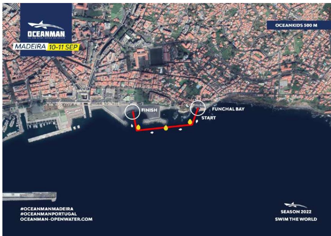
Imagem 6. Croqui – 0,5K (500 metros) OCEAN KIDS