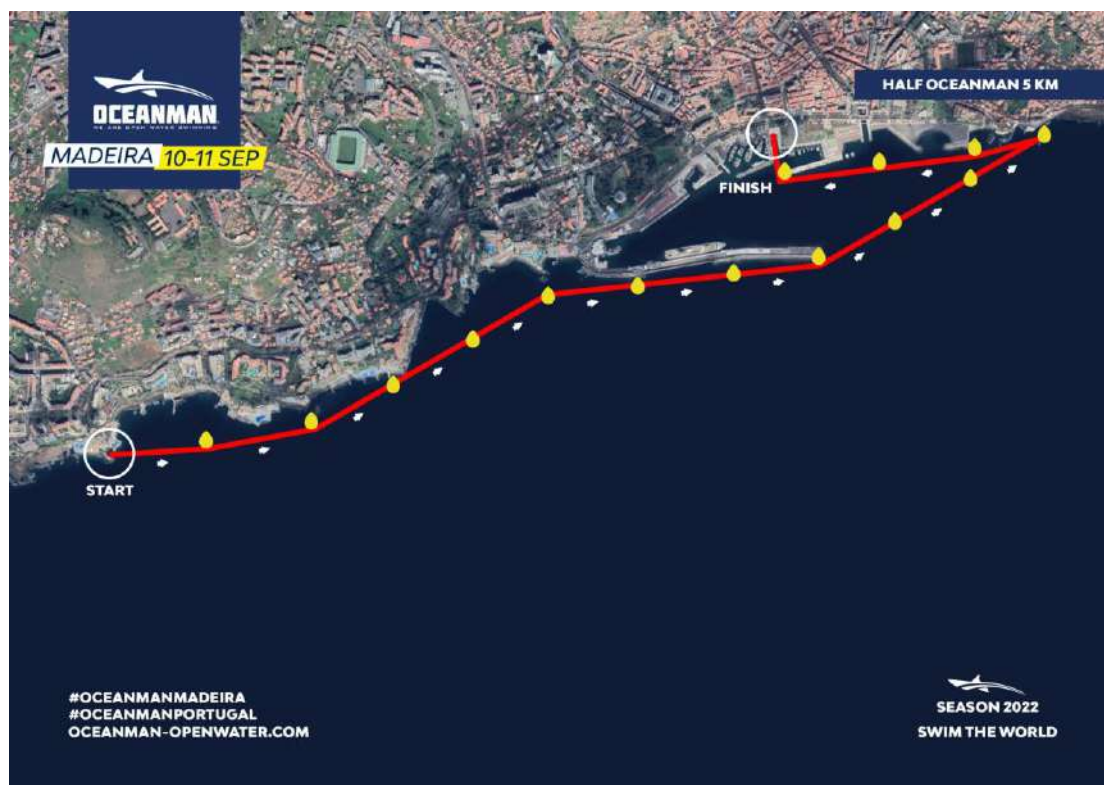
Imagem 3. Croqui – 5K HALF OCEANMAN

Associação de Natação da Madeira Instituição de Utilidade Pública – Resolução n.º 424/2012, de 12 de Junho de 2012