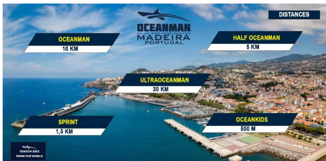
Imagem 1. Provas de Classificação Oficial do Circuito Mundial <OCEANMAN>

NOTA: Todos os prémios estão sujeitos a confirmação.