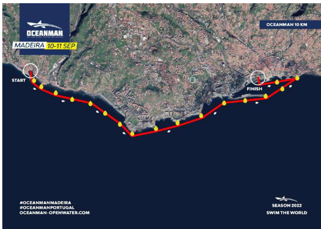
Imagem 2. Croqui – 10K OCEANMAN