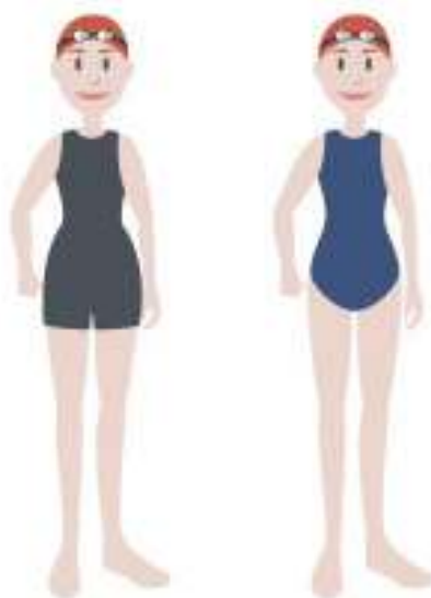
Figura 2 – Equipamentos de competição para as nadadoras infantis B.